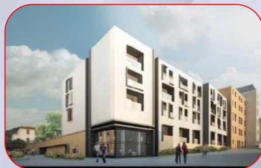
Hôtel de luxe Villa Maïa – 45 ch. - Lyon