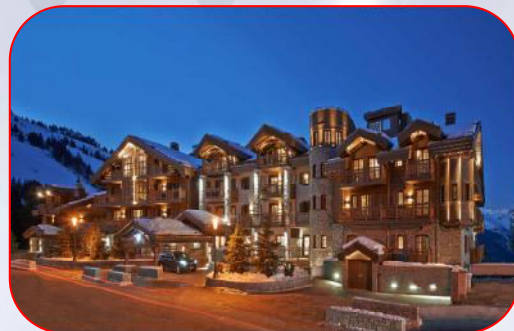
Hôtel 5 étoiles – L'Apogée 33 suites & 20 ch. – Courchevel