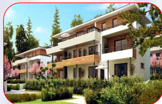
Résidence haut de gamme Quintessence 47 logements – Annecy Le Vieux