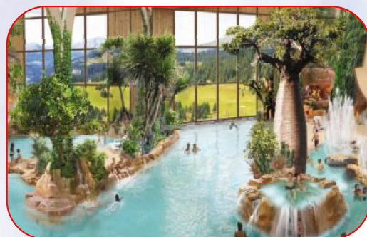
Centre Aqualudique – Avoriaz