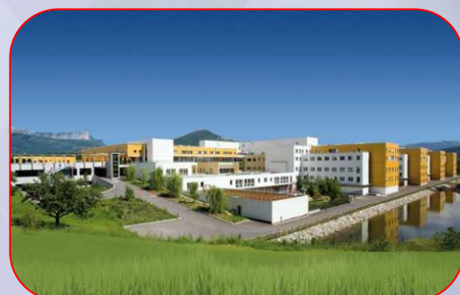
Construction du nouvel hôpital 652 lits Annecy (plomberie sanitaire)