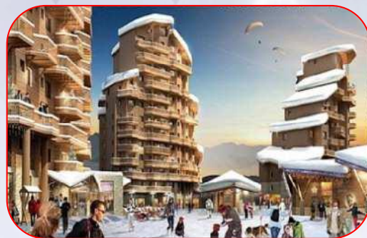
Quartier Falaise et Les Crozats (Pierre & Vacances) – 450 logements de tourisme – Avoriaz