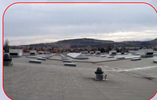
Cora - pose roof top en toiture - Lempdes