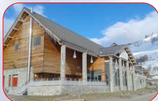
Balnéothérapie de St François Longchamp