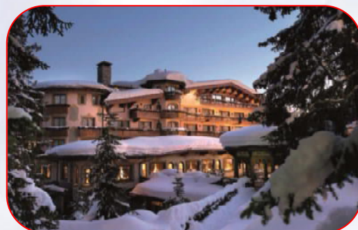
Hôtel 5 étoiles (Palace) - Les Airelles Courchevel