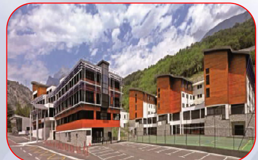
Lycée des métiers de la Montagne – St Michel de Maurienne