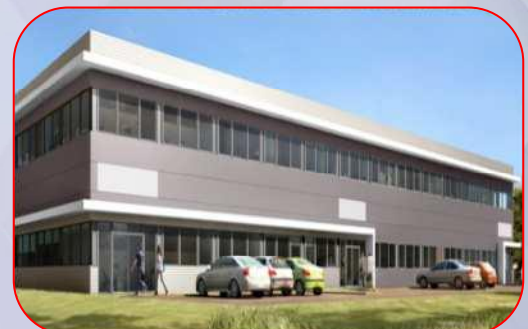
Parc d'activités Innovespace Altaïs – 3 bât. - 3600m 2 - Chavanod