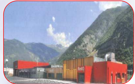
A.P.E.I. de Maurienne – PAC 200kW sur nappe phréatique - Saint-Avre