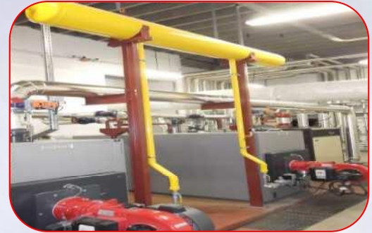
Rénovation chaufferie de 4MW avec sous stations - Foncia – St Jean de Maurienne