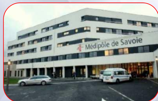
Médipôle de Savoie 4MW chaud, 2MW froid – Challes Les Eaux