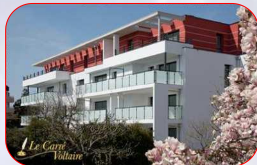
Le Carré Voltaire 147 logements – Ferney Voltaire